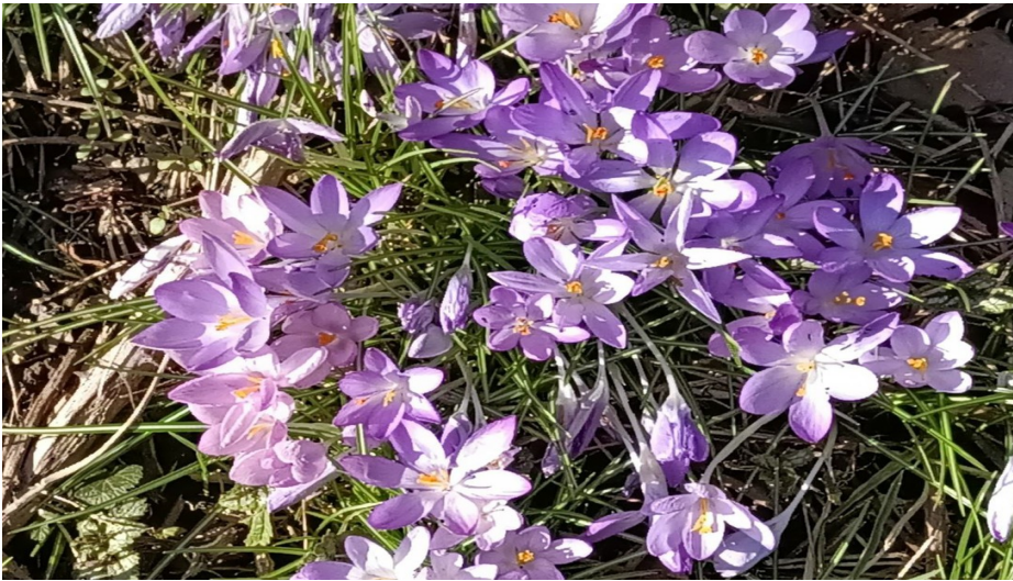
"Violkoloraj krokusoj apud vojpadon")

Mesaĝo de la prezidanto: Estas jam Marto. La komenco de la tria monato promesas sunon kaj pli altajn temperaturojn. Kaj baldaŭ estos tempo komenci sian impostodeklaron, kiu en germanio estas tiel malfacila, ke normala homo bezonas helpon; aŭ per komputilprogramo aŭ de profesiuloj. La nova kanceliero Frederiko Merco ja antaŭ 20 jarojn havis genialan ideon ke estontece ĉiu povus fari sian impostodeklaron sur biermapo, sed la popolo tute ne kredis lin. Hodiaŭ ni scias ke nur kun enkonduko de baza enspezo tiu ja eblus, ĉar tiam amaso da impostoj tute ne ekzistus kaj jam baldaŭ eĉ nenenu rimarkis ilian foreston.