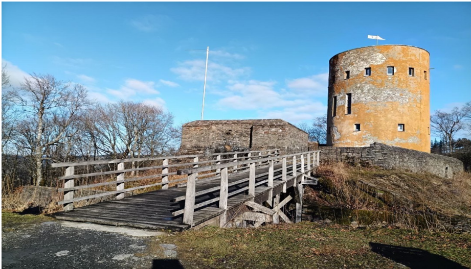
februaro 2025, "La Ginsburg en Vestfalia je la rufa pado (Rothaarsteig)