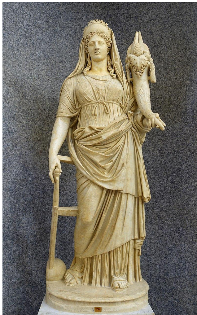
Antikva statuo de la diino Fortuna kun kornukopio kiel atributo

Kaj ke estas tiel, tio sendube je granda parto kaŭziĝas en la koncerna homo mem.