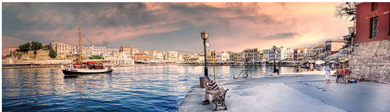
La bela haveno de Chania/Kreto