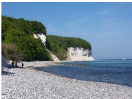
La famaj kretaj rokoj de Rügen

Unue kompreneble, naĝado en la maro estas unu el la plej fortaj asocioj al „ferioj“ (eĉ por tiuj inter ni, kiuj mem ne nepre vere naĝas), kaj evidente insuloj havas rilate al sia grandeco tre longan marbordon kompare kun aliaj regionoj, tiel ke oni povas trovi kvietajn strandojn kaj infrastrukture bone organizitajn amasplaĝojn, laŭplaĉe. Krome, pro la interagado de la naturaj fortoj de akvo kaj vento, la marbordo en si mem estas tre speciala pejzaĝo, kiu povas formiĝi tute malsamkaraktere en diversaj lokoj – kun klifoj aŭ ebena strando aŭ kun dunoj, ĉio allogas siamaniere.