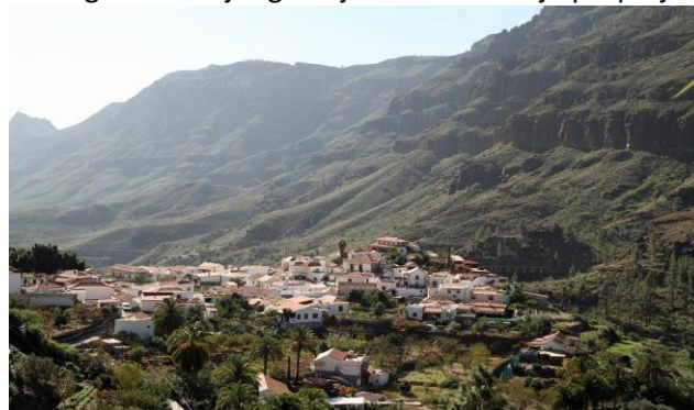
Ĉarmaj urbetoj en fekundaj valoj inter krutaj montoj – Gran Canaria

Due ankaŭ por homoj, kiuj interesiĝas pri biologio, insuloj havas apartan allogon: faŭno kaj flaŭro sen interŝanĝo kun aliaj regionoj ofte naskis siajn proprajn